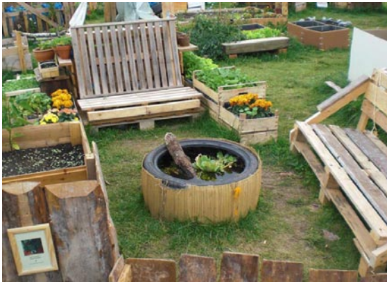
Allmende_Kontor, Berlin