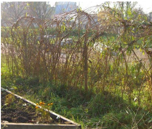
Weidenzaun des Interkulturellen Gartens in Hamburg/Wilhelmsburg