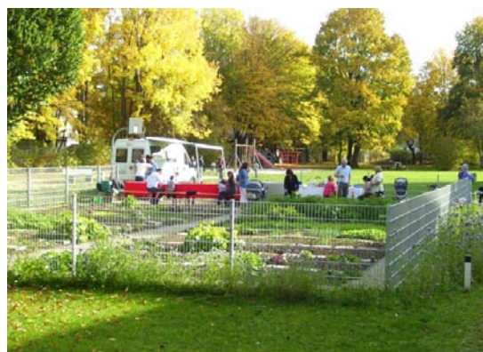
Bewohnergarten in München/Berg am Laim